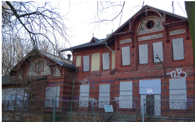
Foto: Eierhäuschen im Plänterwald

Aus dem „Sondervermögen Infrastruktur der wachsenden Stadt“ (SIWA) des Landes Berlin werden 10 Mio. Euro für den Spreepark und das Eierhäuschen zur Verfügung gestellt, um das Gelände für künftige Betreiber investitionsfähig zu machen. 3 Mio. Euro stehen für die Beräumung des Spreeparkgeländes und 7 Mio. Euro für die Sanierung und Erschließung des Eierhäuschens zu Verfügung.