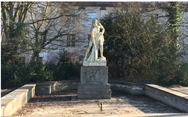
Foto: Fischerbrunnen am Rathaus Treptow

Das aufwändigste und größte Projekt des Bezirkes ist die Sanierung der viel genutzten historischen Parkanlage Treptower Park 2015/16, wo die Hauptfinanzierung aus EU-Mitteln erfolgt. Die Steganlage auf der Insel der Jugend wird wieder hergerichtet. Die Sanierung der Grünanlage mit dem denkmalgeschützten Fischerbrunnen vor dem Rathaus Treptow ist 2018/19 angedacht.